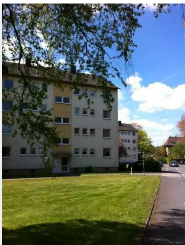
Außenansicht Hirschberger Str.