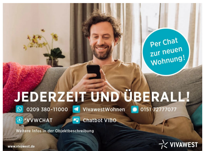
Kontakt per Messenger!