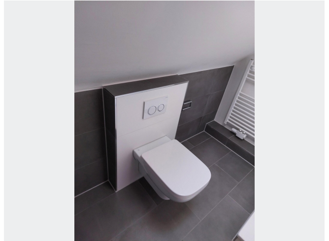
Bad Beispielfoto 1