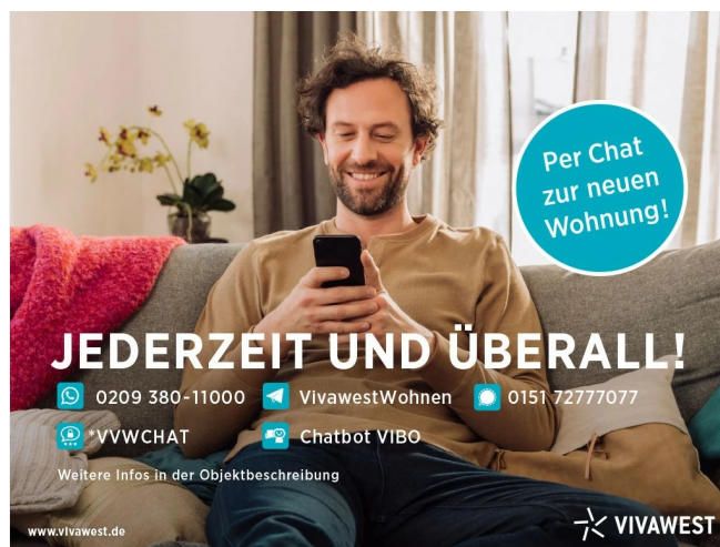
Kontakt per Messenger!