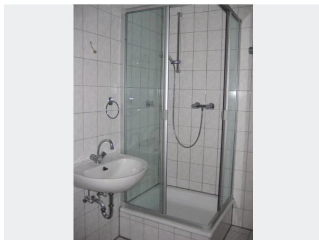
Bad mit Dusche