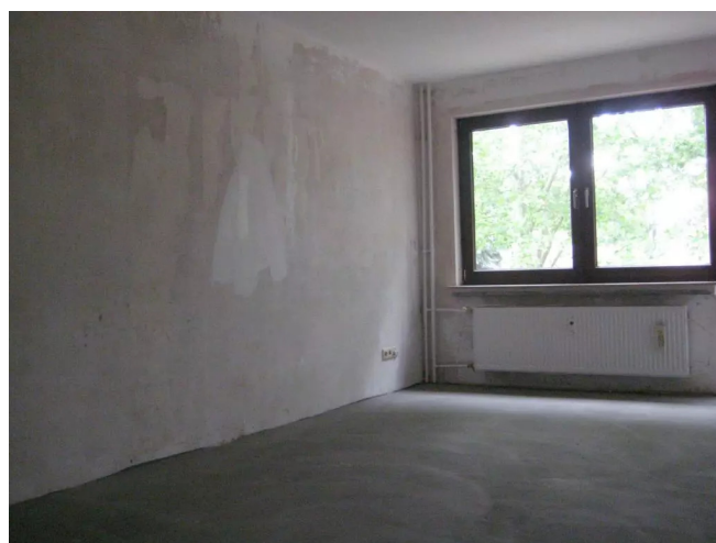
Wohnzimmer mit Balkon