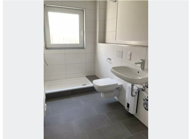
Tageslichtbad Dusche Muster