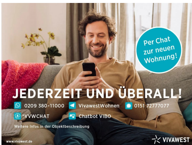
Kontakt per Messenger!