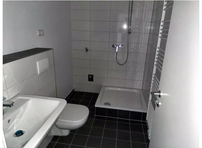
Bad mit Dusche beispielhaft