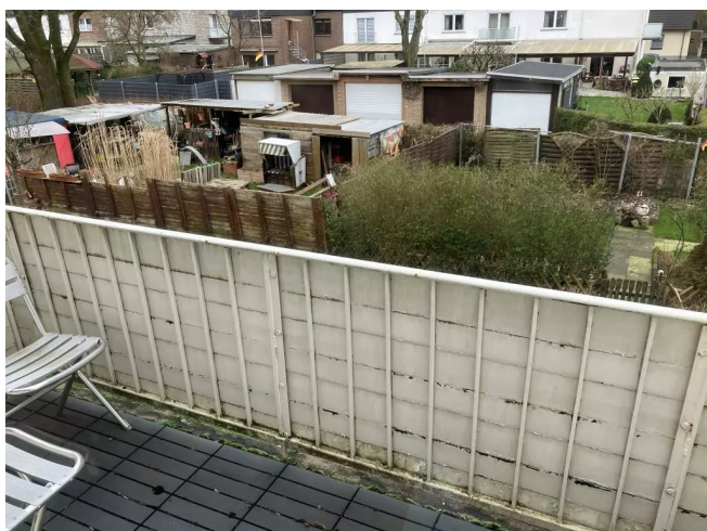
Hügelstr. 16 OGR Balkon