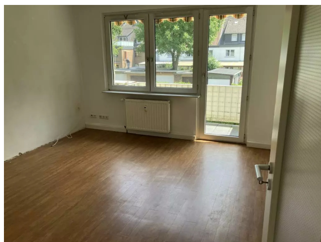
Hugelstr 16 OGR Wohnzimmer