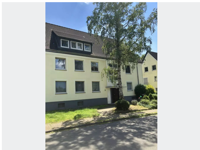
Hugelstr 16 Strassenseite