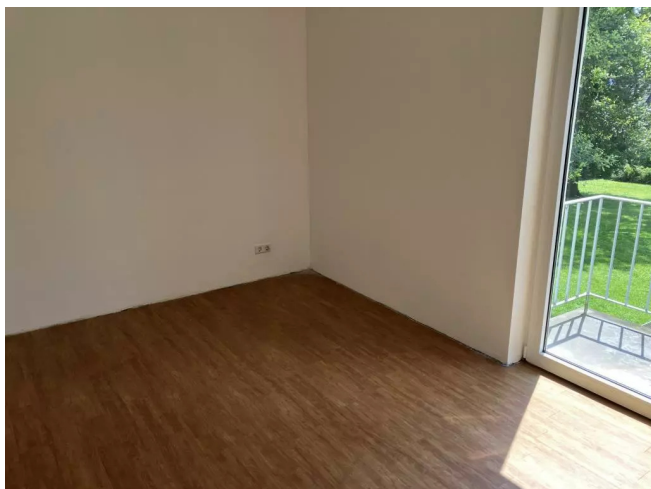
Hügelstr 16 OGR Schlafzimmer