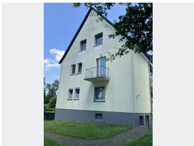
Hugelstr 16 Giebel