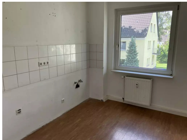
hügelstr 16 OGR Küche