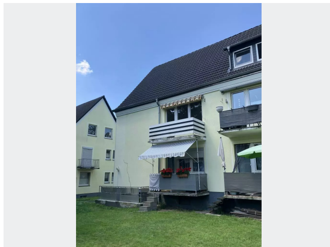
Hugelstr 16 Balkonseite