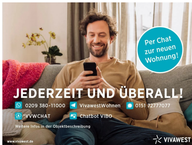
Kontakt per Messenger!