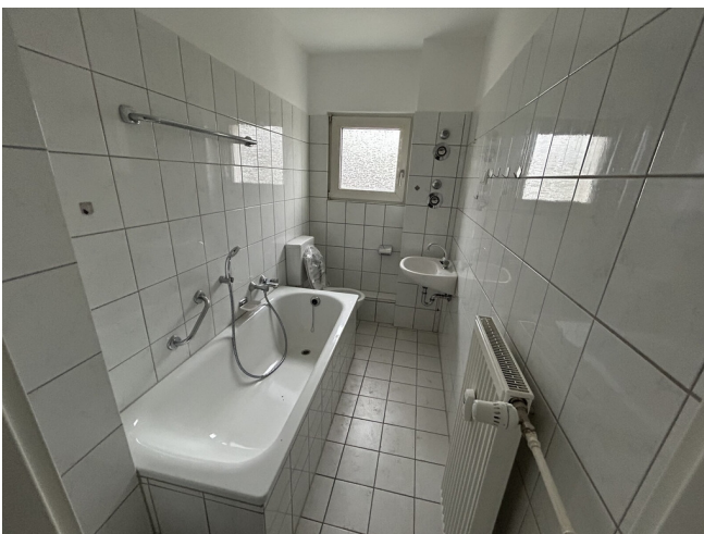
Wannenbad mit Fenster