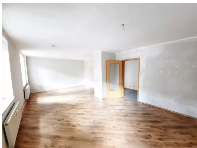
Wohn u Schlafrum