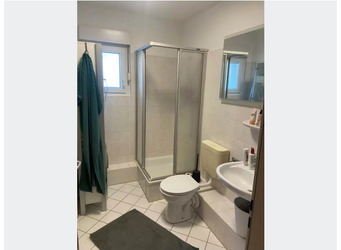
Duschbad mit Fenster