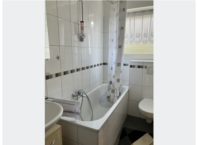
Wannenbad mit Fenster