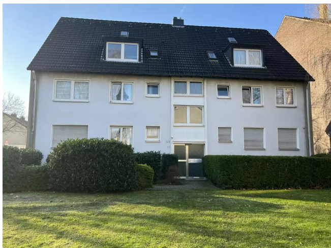
Außenansicht Im Schollbrauk 43