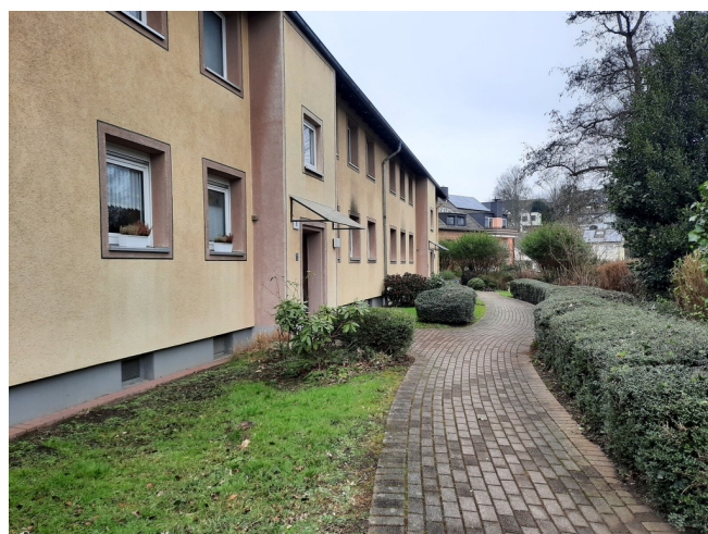
Bürkenweg 10 1. OG li