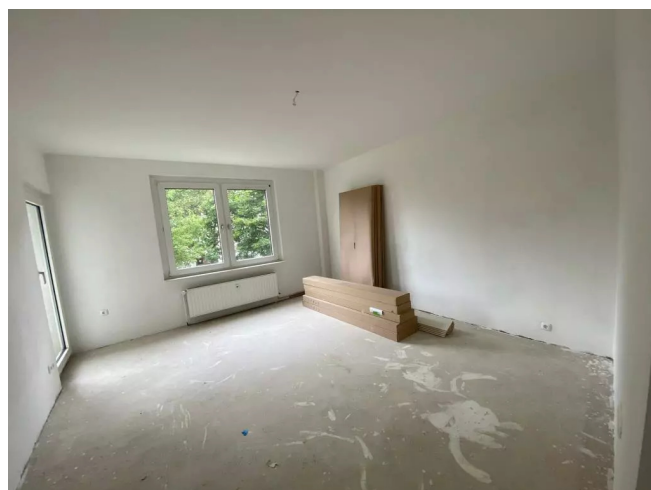
Wohnzimmer - Muster