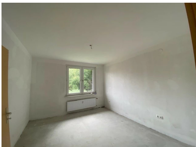
Schlafzimmer - Muster