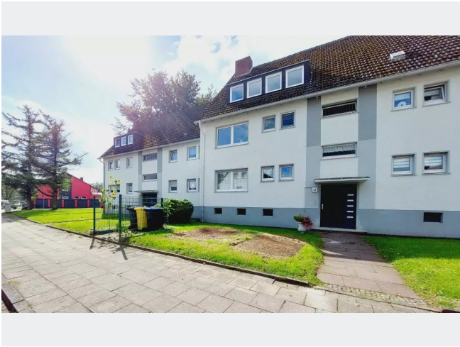
Reulstr. 23 & 25