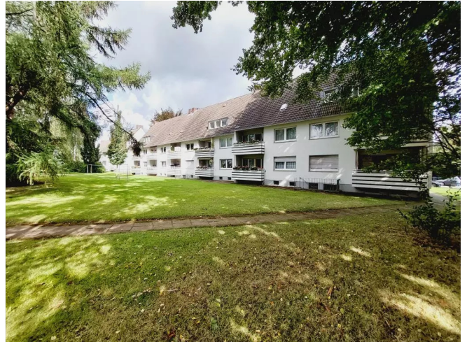
Rückansicht Reulstr. 21, 23 &