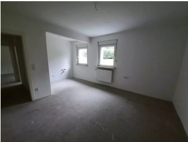
Wohnküche - Muster