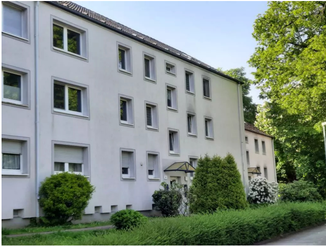
Außenansicht - Muster