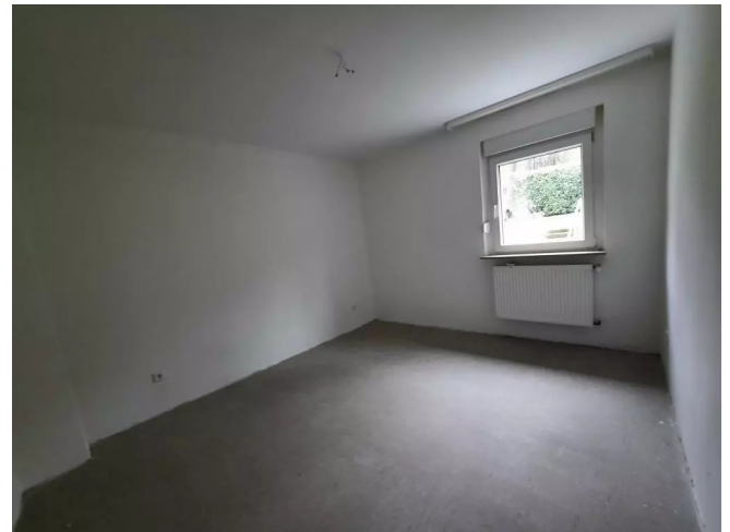
Schlafzimmer - Muster