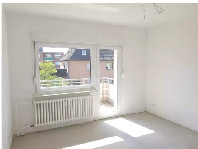
WZ mit Balkon