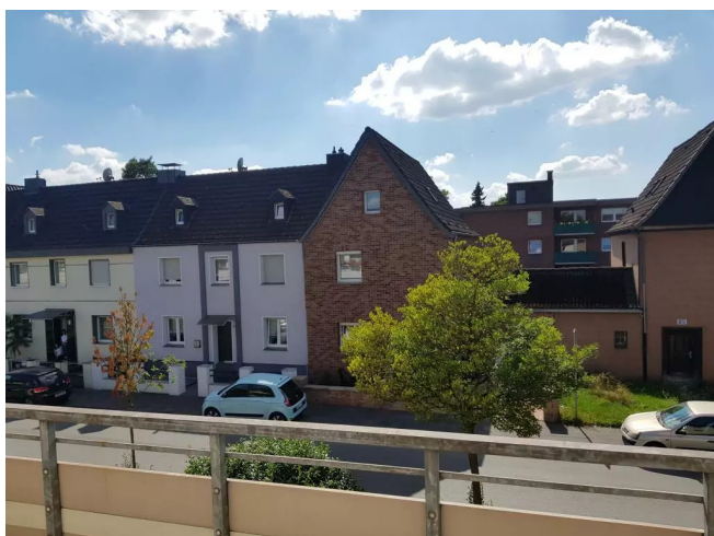
Sicht v Balkon