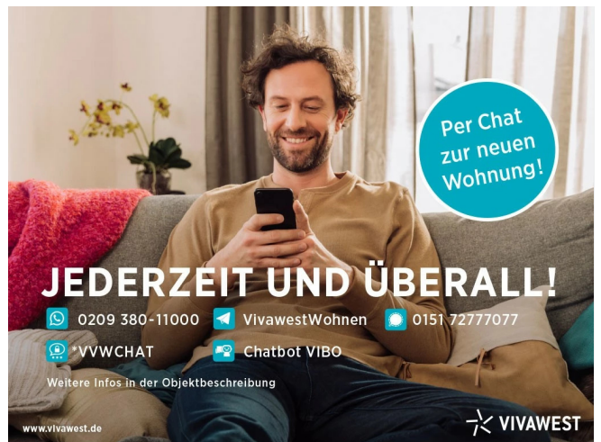
Bild Messenger Internetanzeige