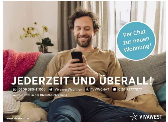
Bild Messenger Internetanzeige