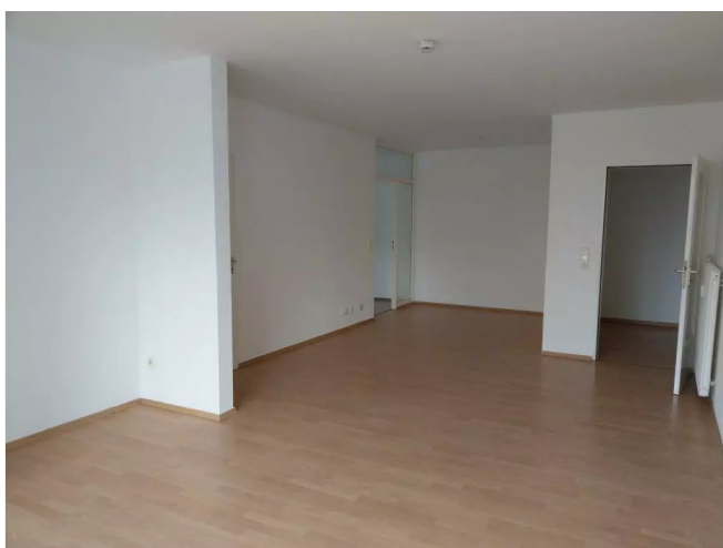
Wohn- Essbereich mit Balkon