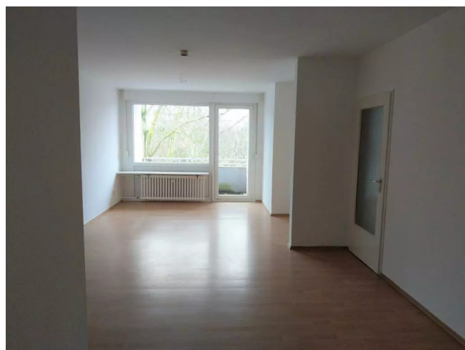
Wohn- Essbereich mit Balkon