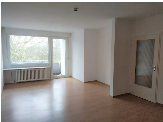
Wohn- Essbereich mit Balkon