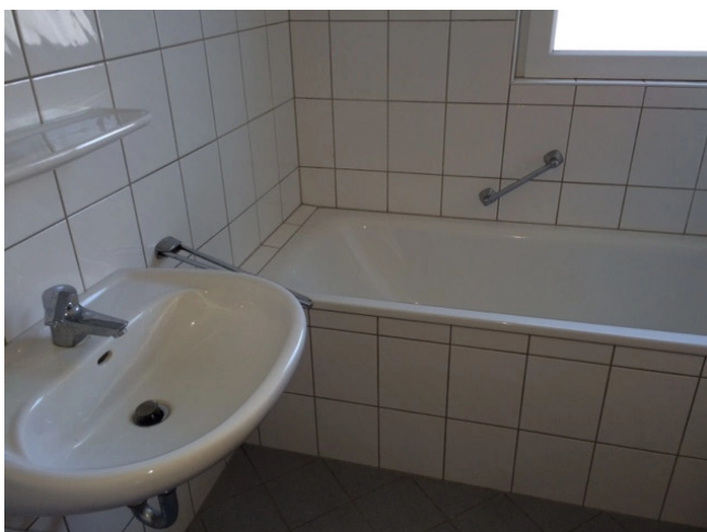
weißes Wannenbad mit Fenster