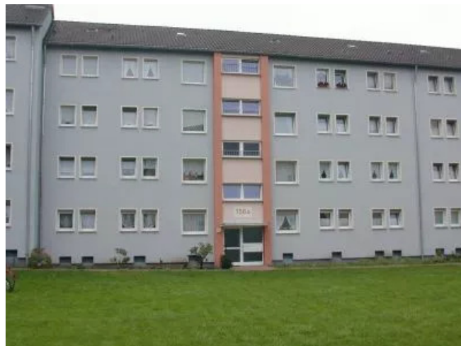
grün vor und hinter dem Haus