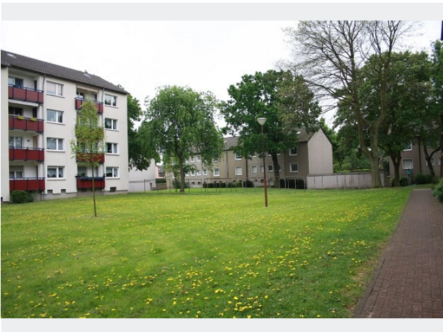
Blick auf die Grünflächen