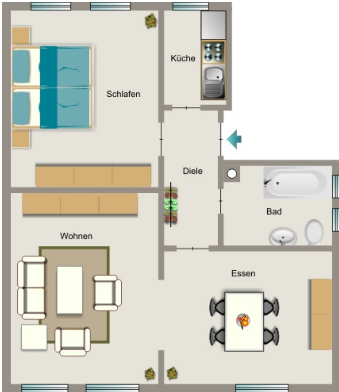
Zum Gottesacker 26 Erdgeschoss rechts