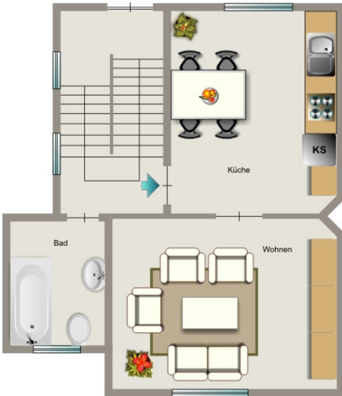
Ottostrasse 12 Erdgeschoss links