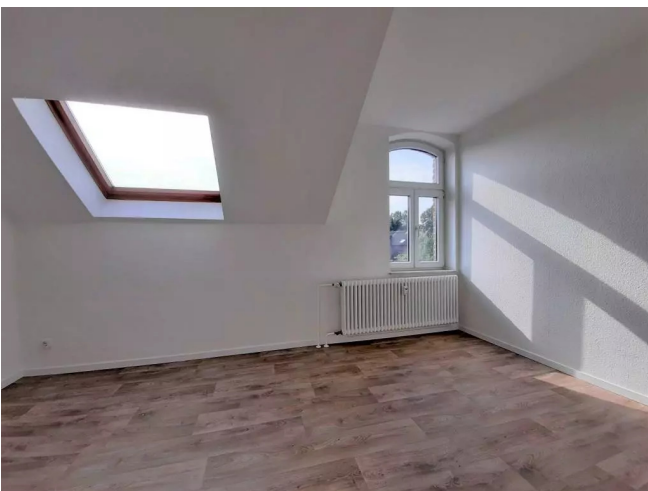
Wohn-/Schlafzimmer - Beispiel