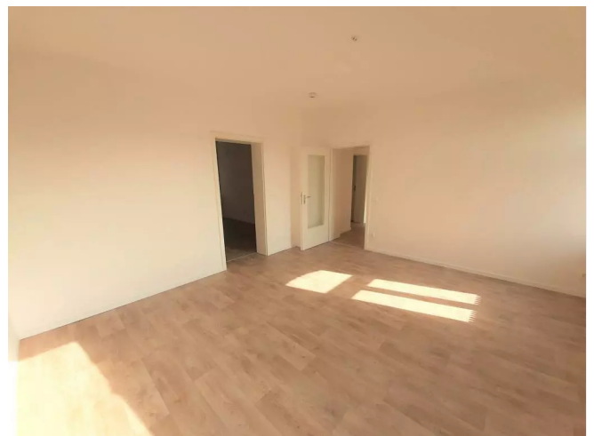
Wohnzimmer - Beispielansicht