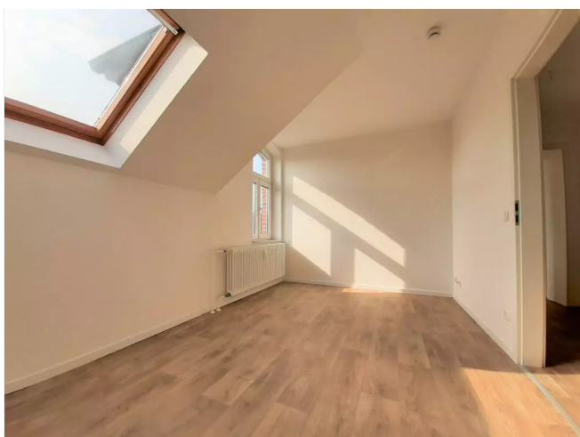
Kinderzimmer - Beispielsicht