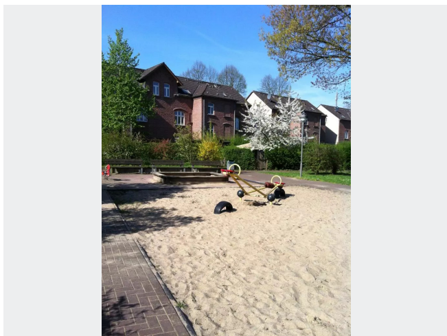
Spielen kann man überall