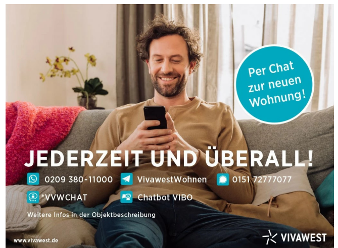
Kontakt per Messenger!