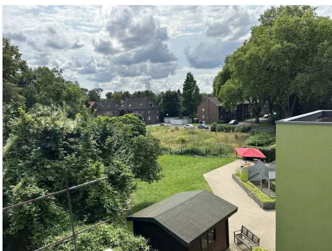
Ausblick vom Balkon