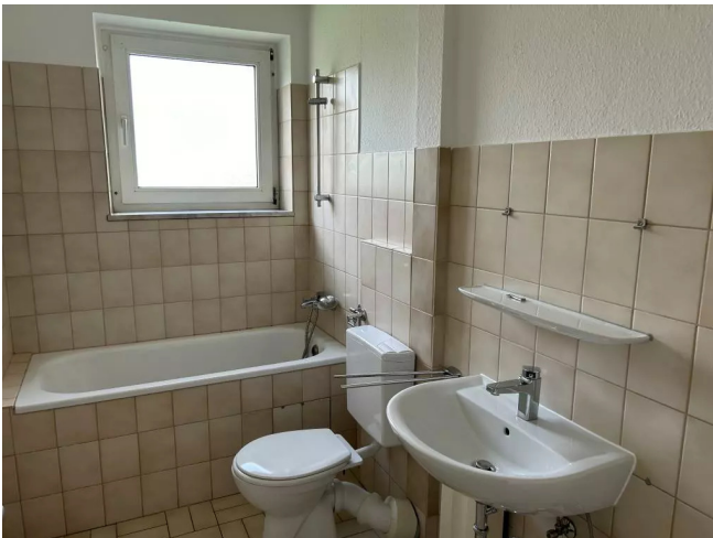
Bad mit Fenster