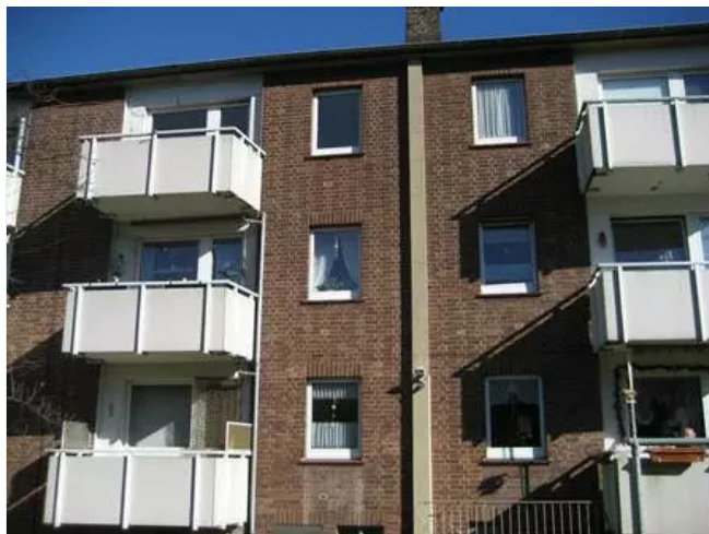
Rückfront mit Balkonen