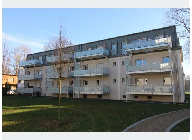
Rückansicht Nr. 46 u. 48