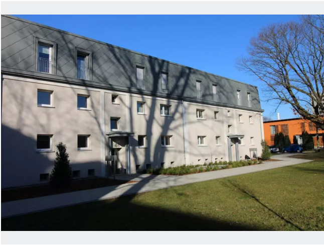
Hauszugang Nr. 46-48