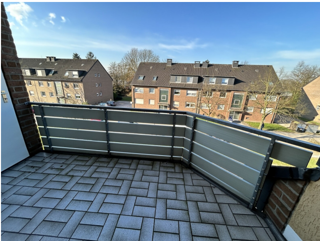
Balkon mit Abstellraum