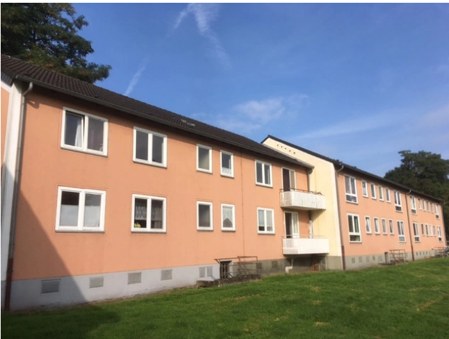
Oswaldstr. 58-62 vorher