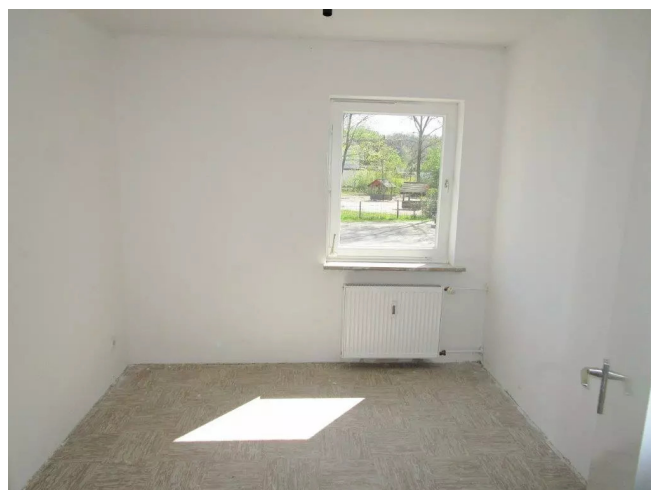
Kinder- / Esszimmer