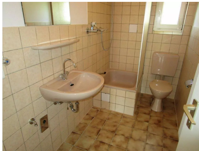
Bad mit Dusche u. WM-Stellplat