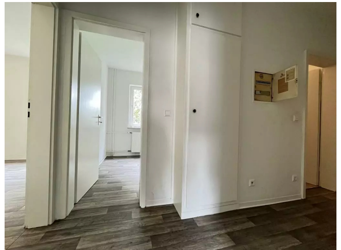
Beispiel Diele / Wandschrank