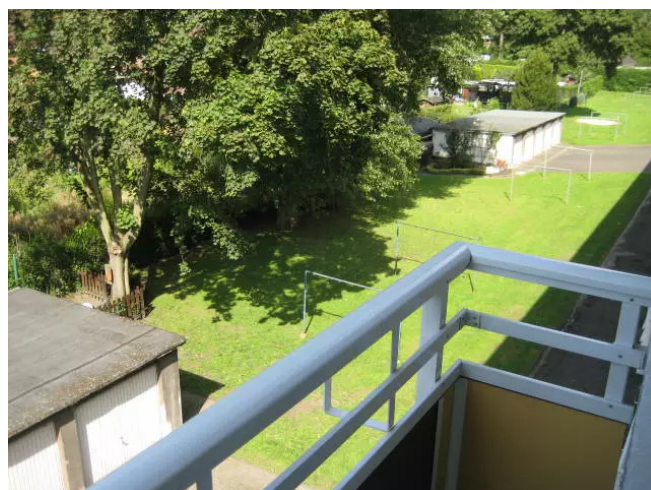
Blick v. Balkon