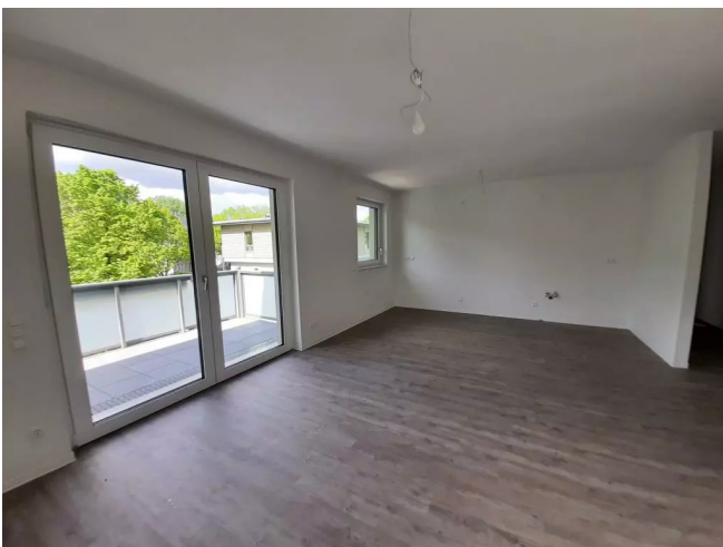
Wohnbereich_ Küche Beispiel