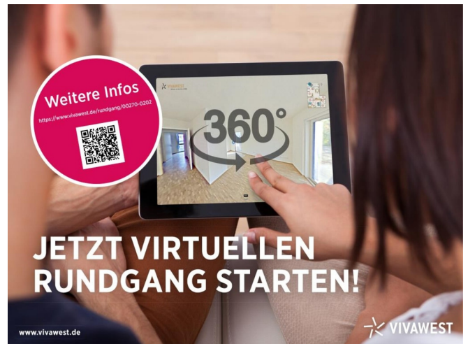
360 Grad Tour