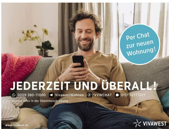
Bild Messenger Internetanzeige