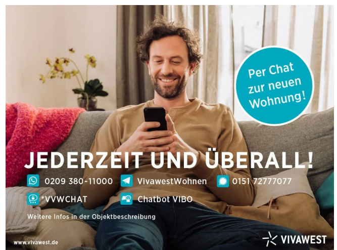
Kontakt per Messenger!