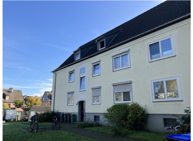
Hainweg 16 Hauseingang