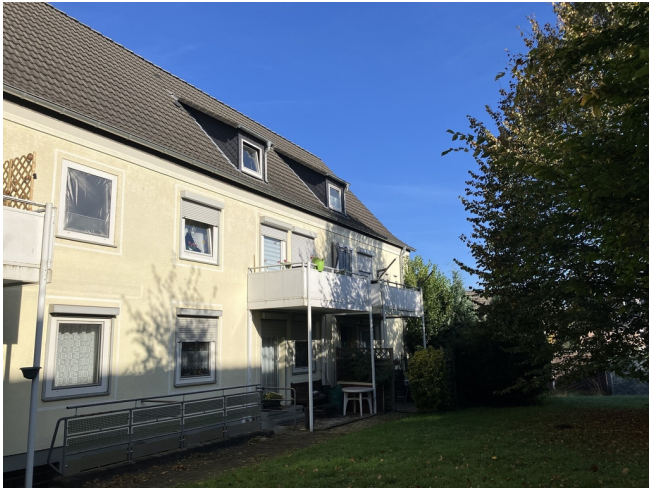
Hainweg 16 Balkonseite