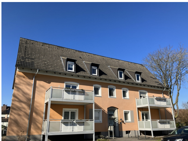
Im Drubbel 7 Strassenseite