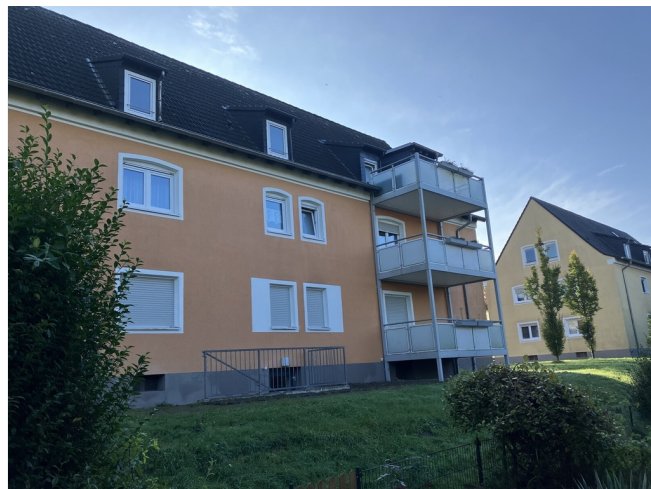
Im Drubbel 7 Rückseite