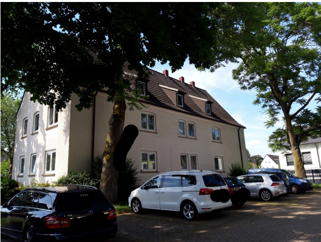
Am Heikenberg 2 Rückseite