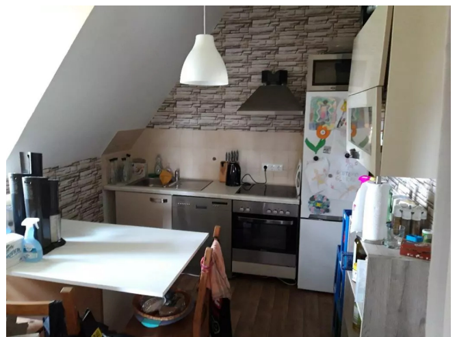
Am Heikenberg 2 DGR Küche