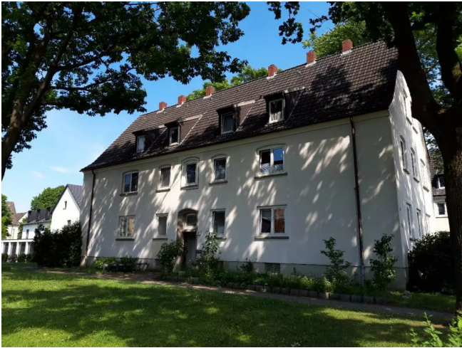
Am Heikenberg 2 Hauseingang