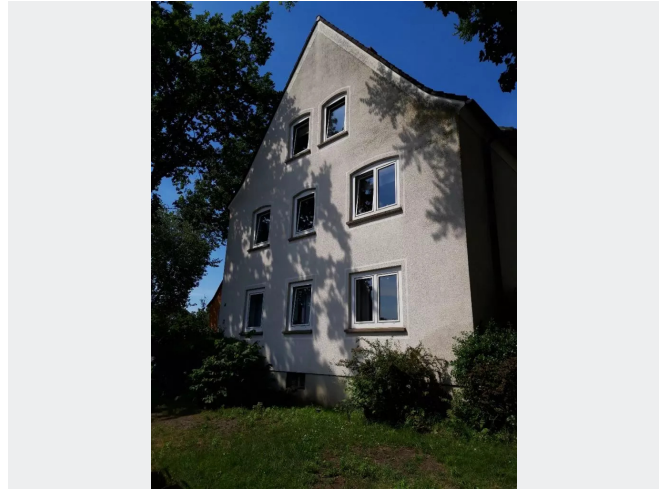
Am Heikenberg 2 Giebelseite