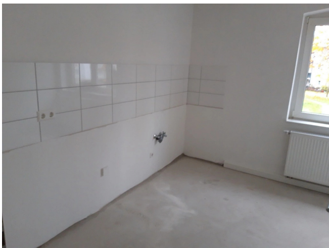
Am Heikenberg Musterküche