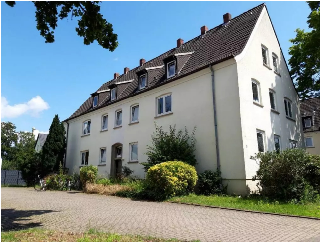
Am Heikenberg 6 Ansicht