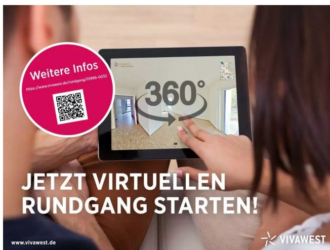
360 Grad Begehung