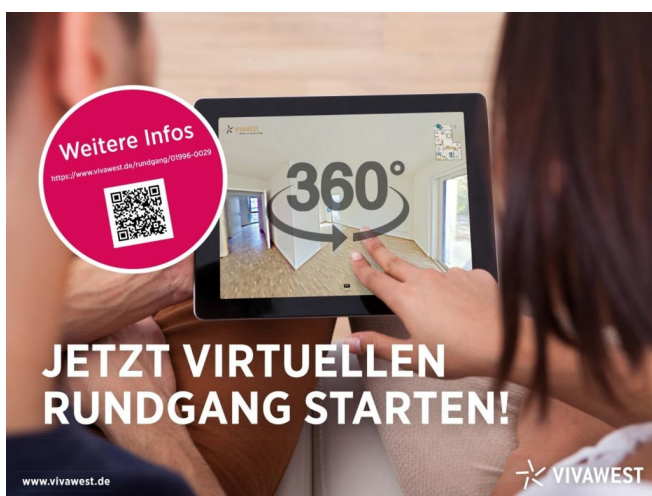
360 Grad Begehung