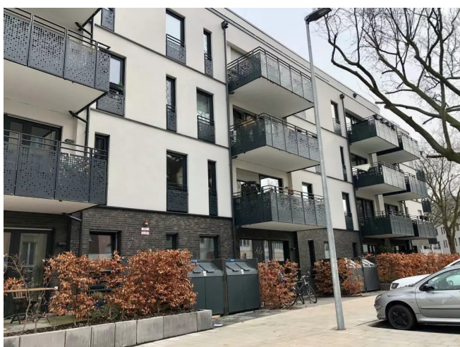
Außenansicht Hofhaus 3