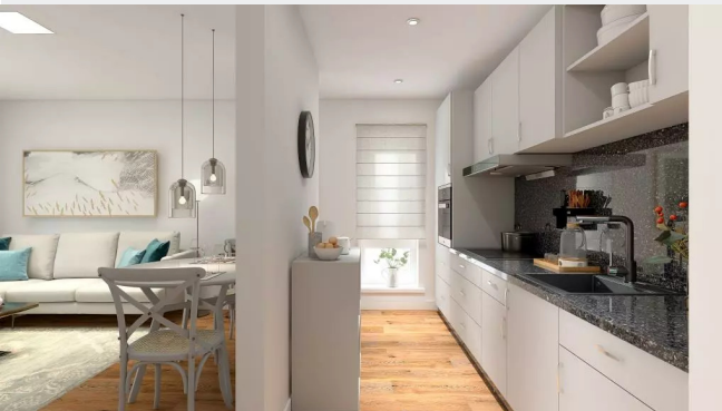
Wohnzimmer mit Küche