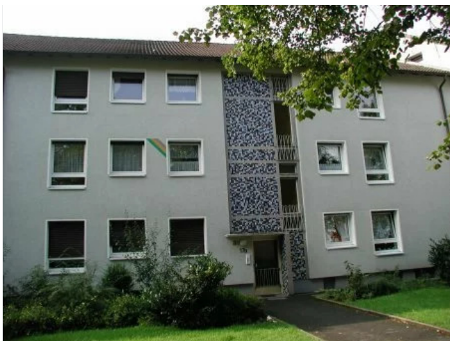
Dortmunder Str. 17 a, Bild 2