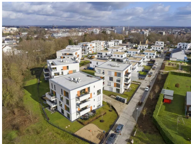
Wohnanlage Am Vituspark