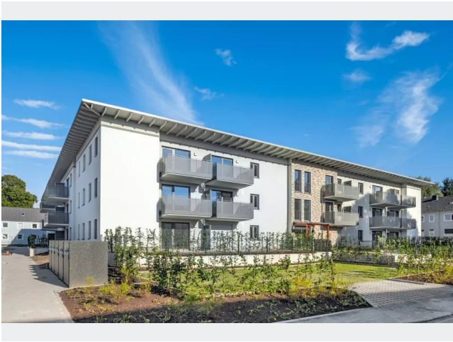
Im Nörenderger Feld 33